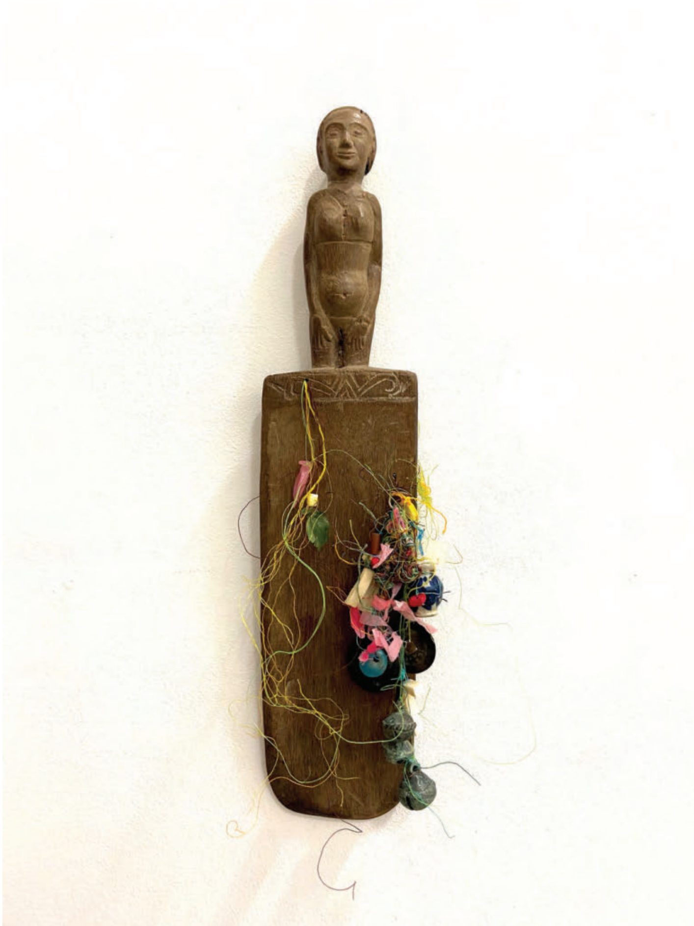
The Healer , 2023