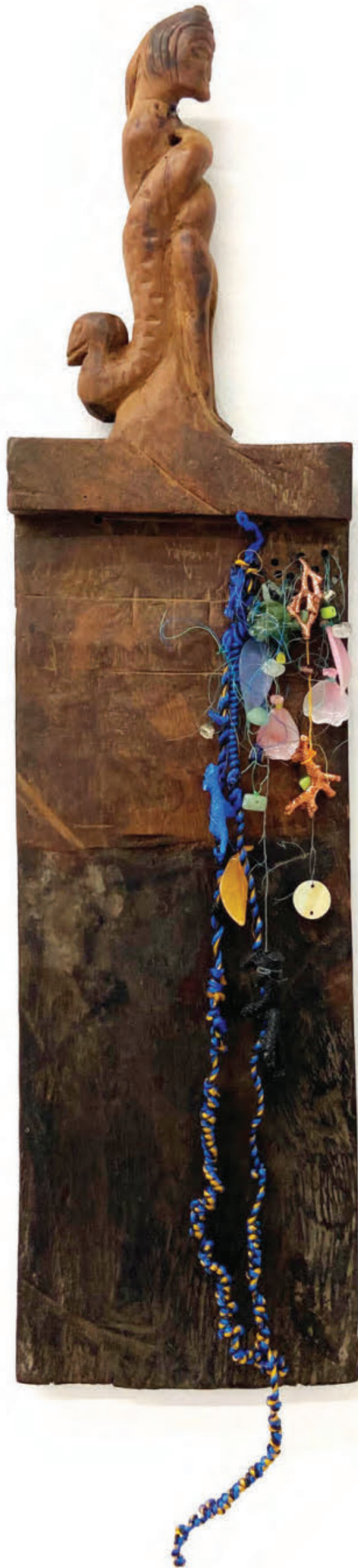
Little Mermaid, 2023