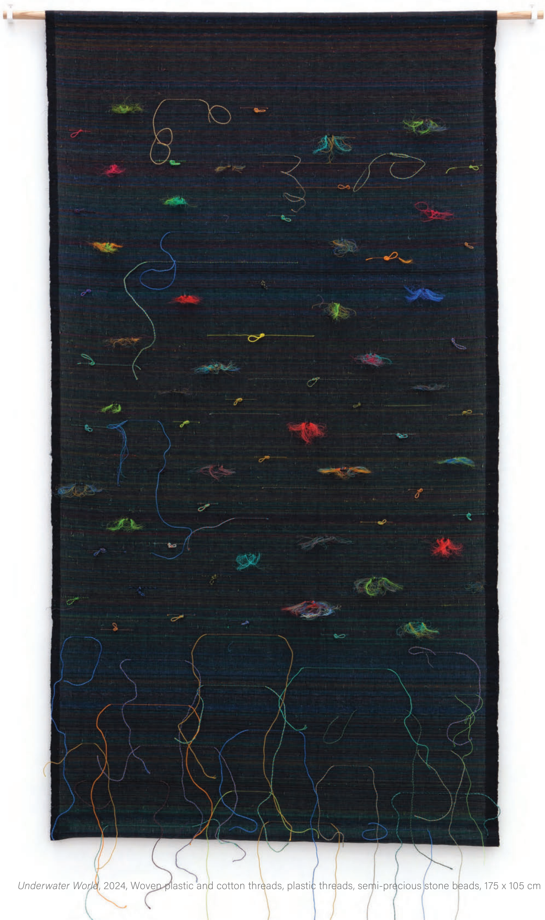
Underwater World , 2024, Woven plastic and cotton threads, plastic threads, semi-precious stone beads, 175 x 105 cm