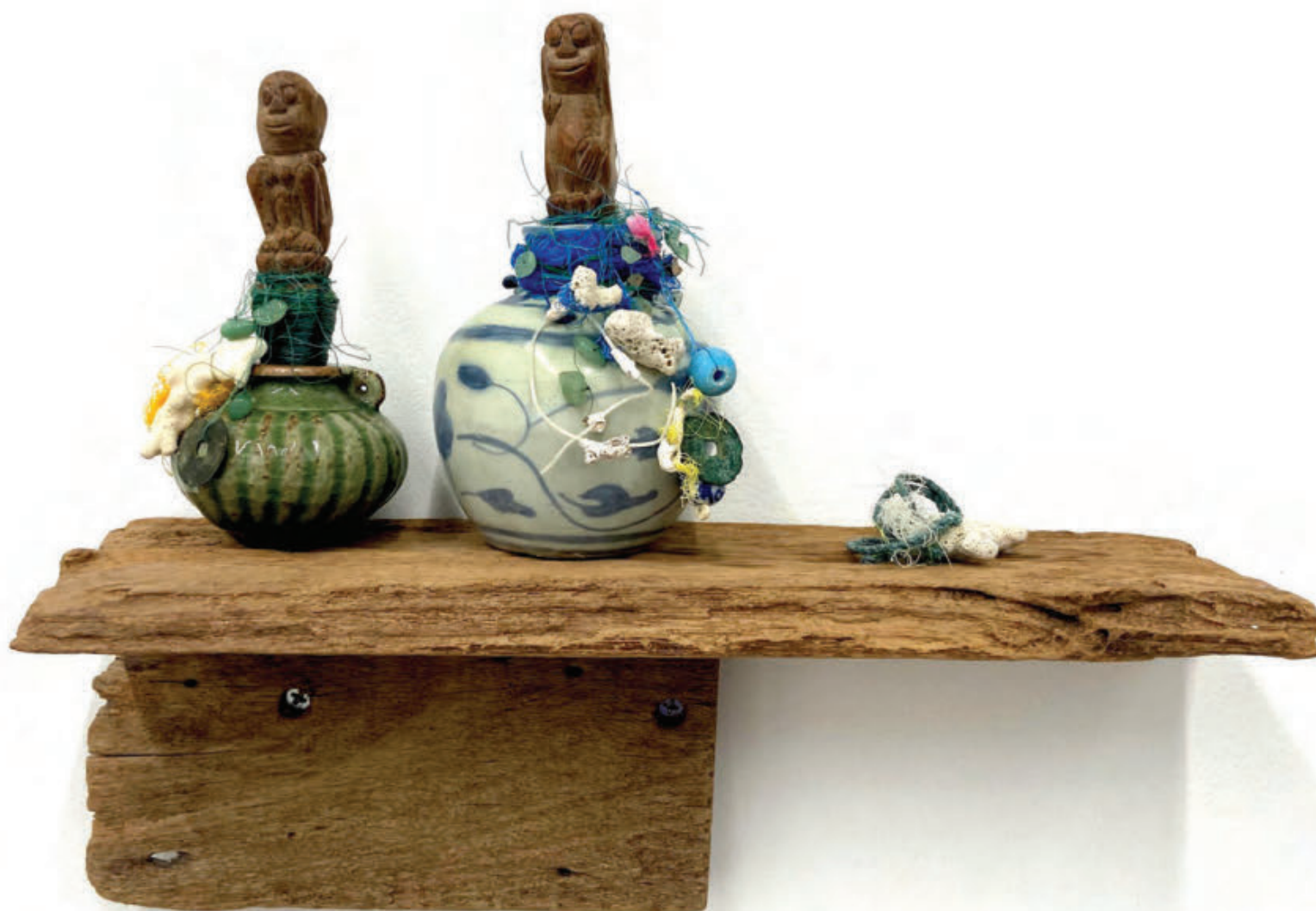
Holy Water Container #2, #3, 2023

Mixed media, 13.5 x Ø 6.5 cm, 15.5 x Ø 8 cm