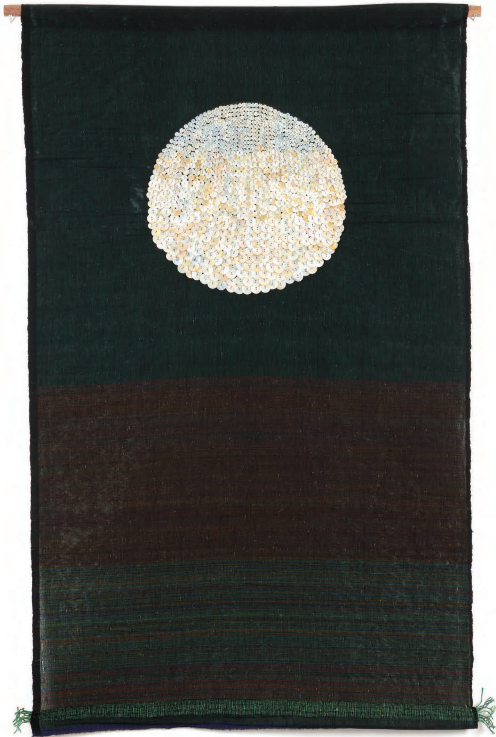
Mid-Autumn Moon , 2024, Woven plastic and cotton threads, mother of pearl, 166 x 112 cm