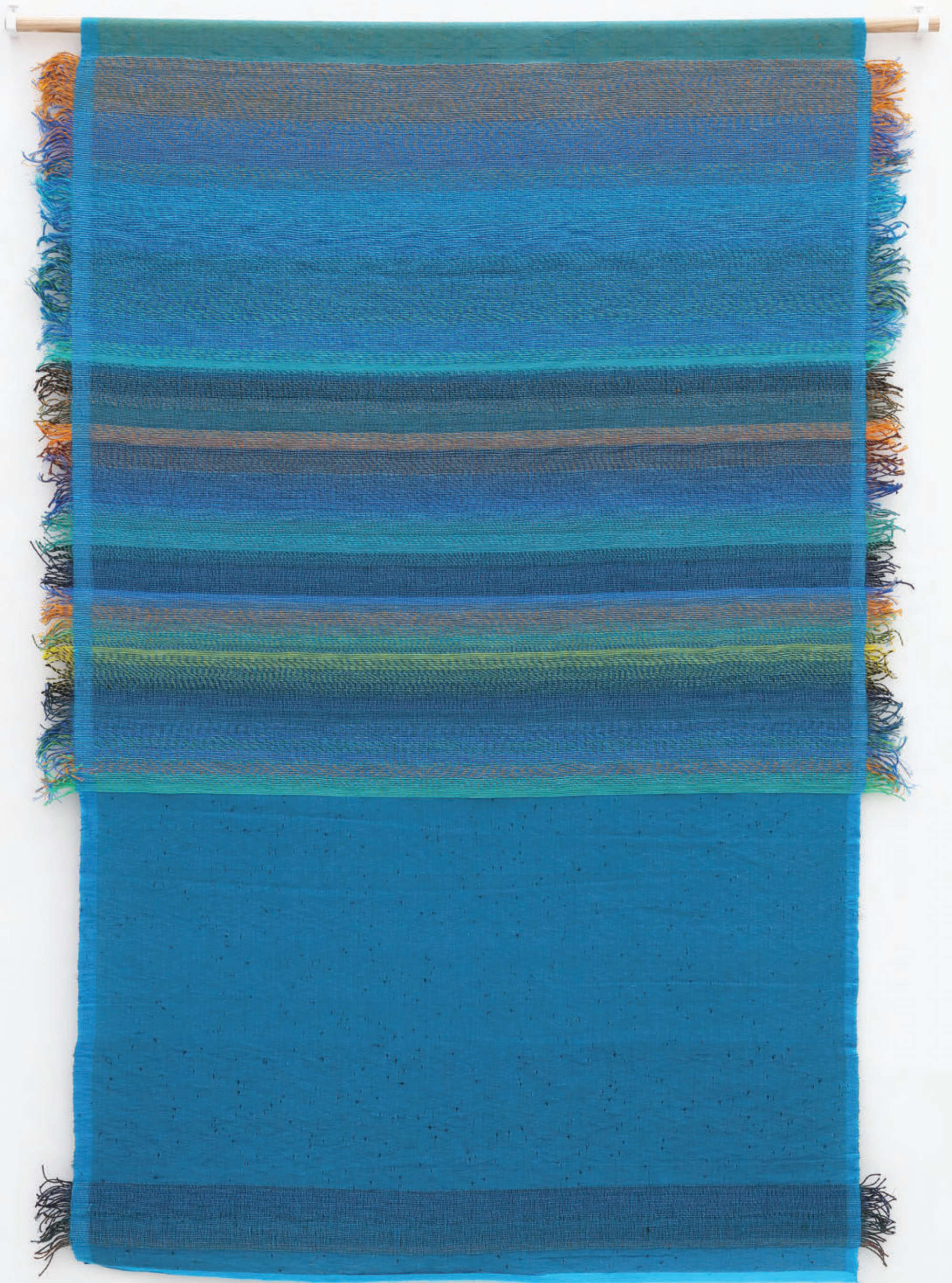
Calm Ocean at Dawn , 2024, Woven plastic and cotton threads, plastic chords, 167 x 119 cm