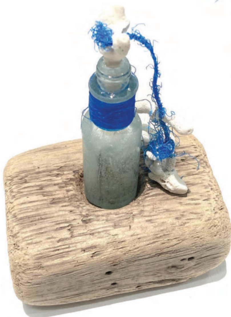
Holy Water #3, 2025