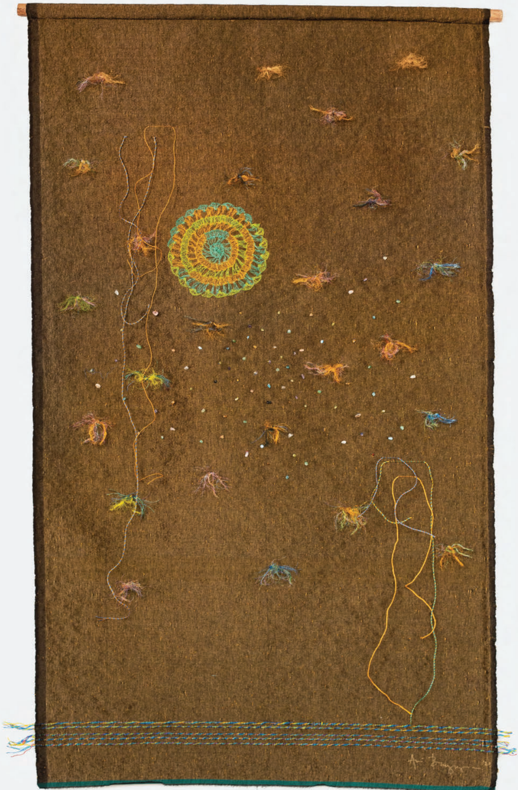
Floating World Under the Ocean #1, 2023, Woven plastic and cotton threads, plastic threads, semi-precious stone beads, 175 x 112 cm