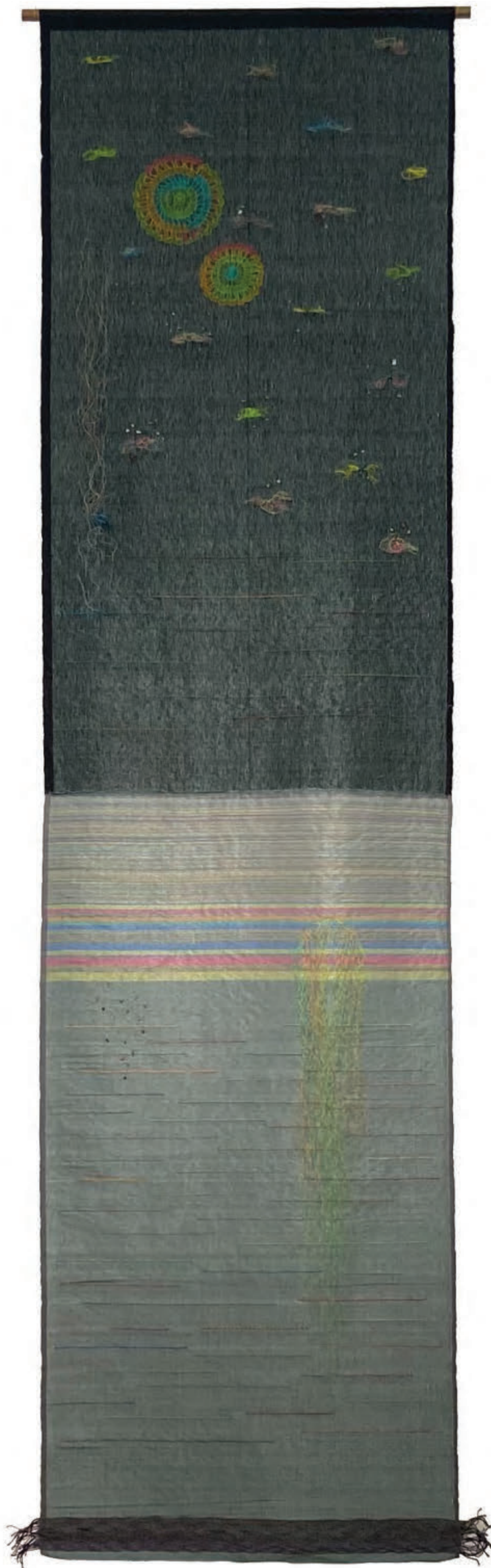
The Diving , 2025, Woven plastic and cotton threads, plastic threads, semi-precious stone beads, 376 x 104 cm