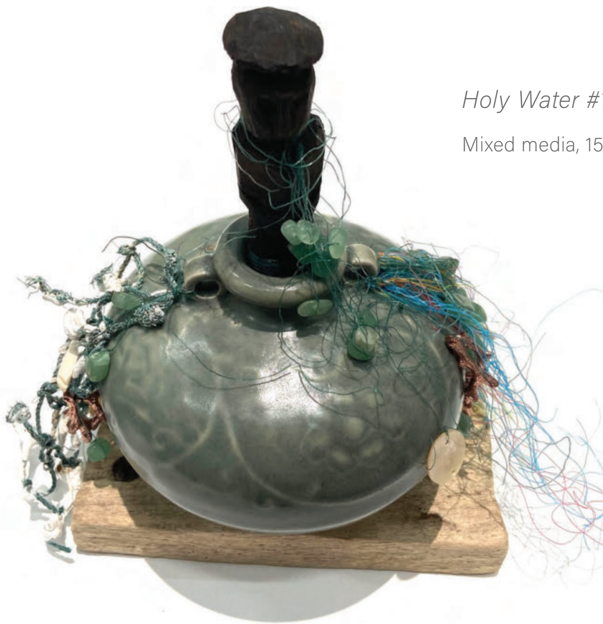
Holy Water #1, 2025