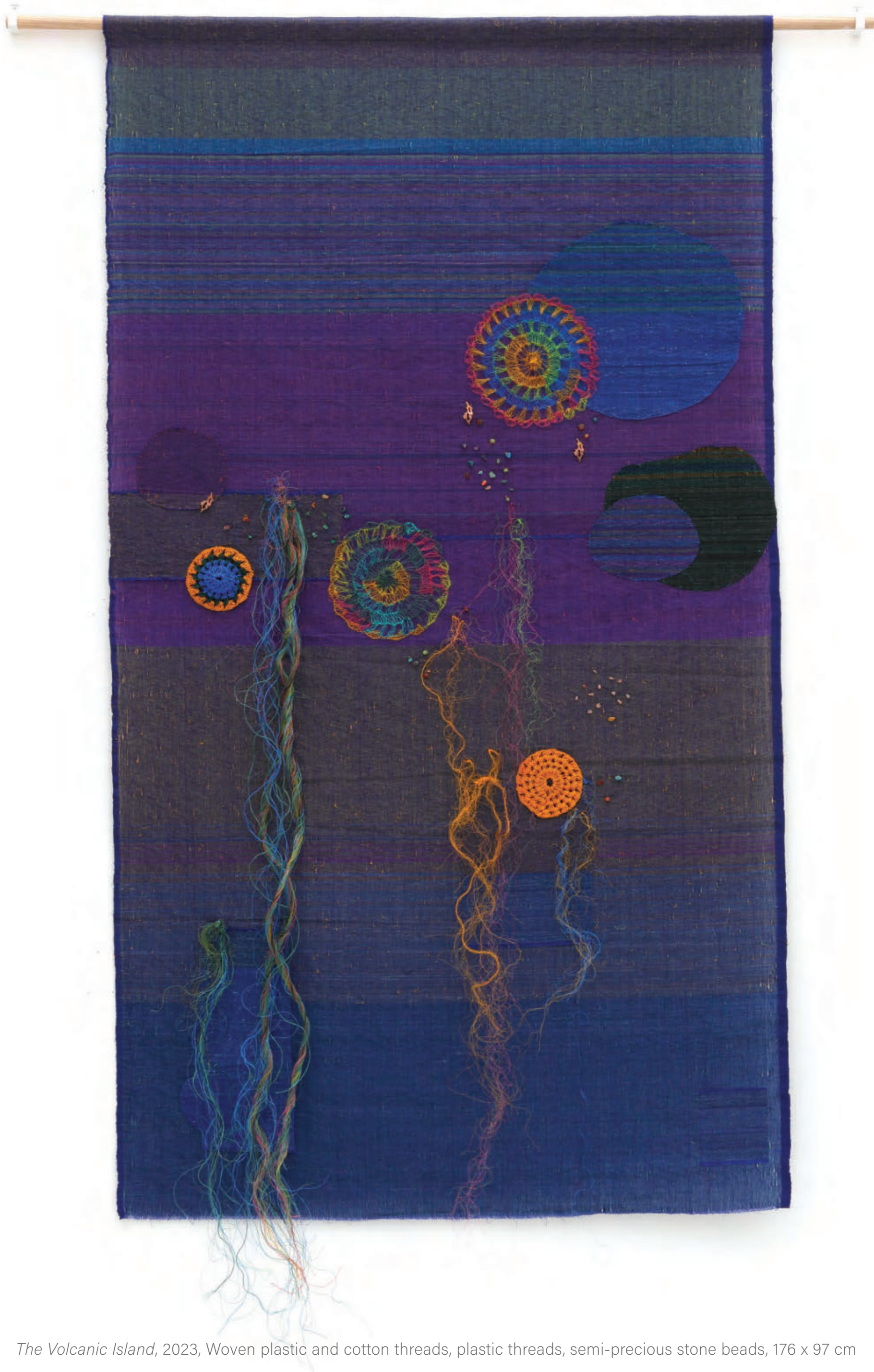
The Volcanic Island , 2023, Woven plastic and cotton threads, plastic threads, semi-precious stone beads, 176 x 97 cm