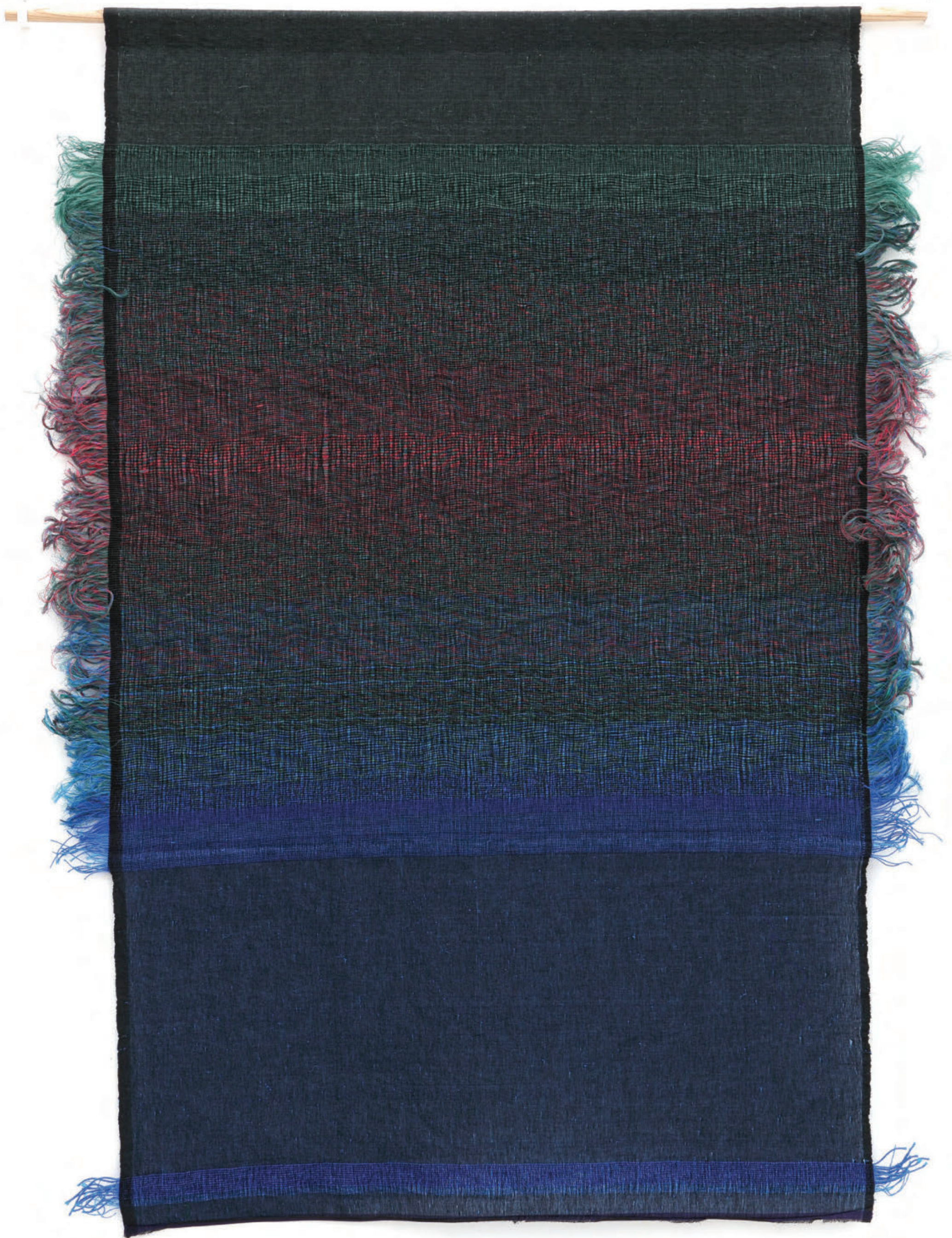
The Light in the Mangrove Forest , 2024, Woven plastic and cotton threads, plastic threads, semi-precious stone beads, 160 x 132 cm