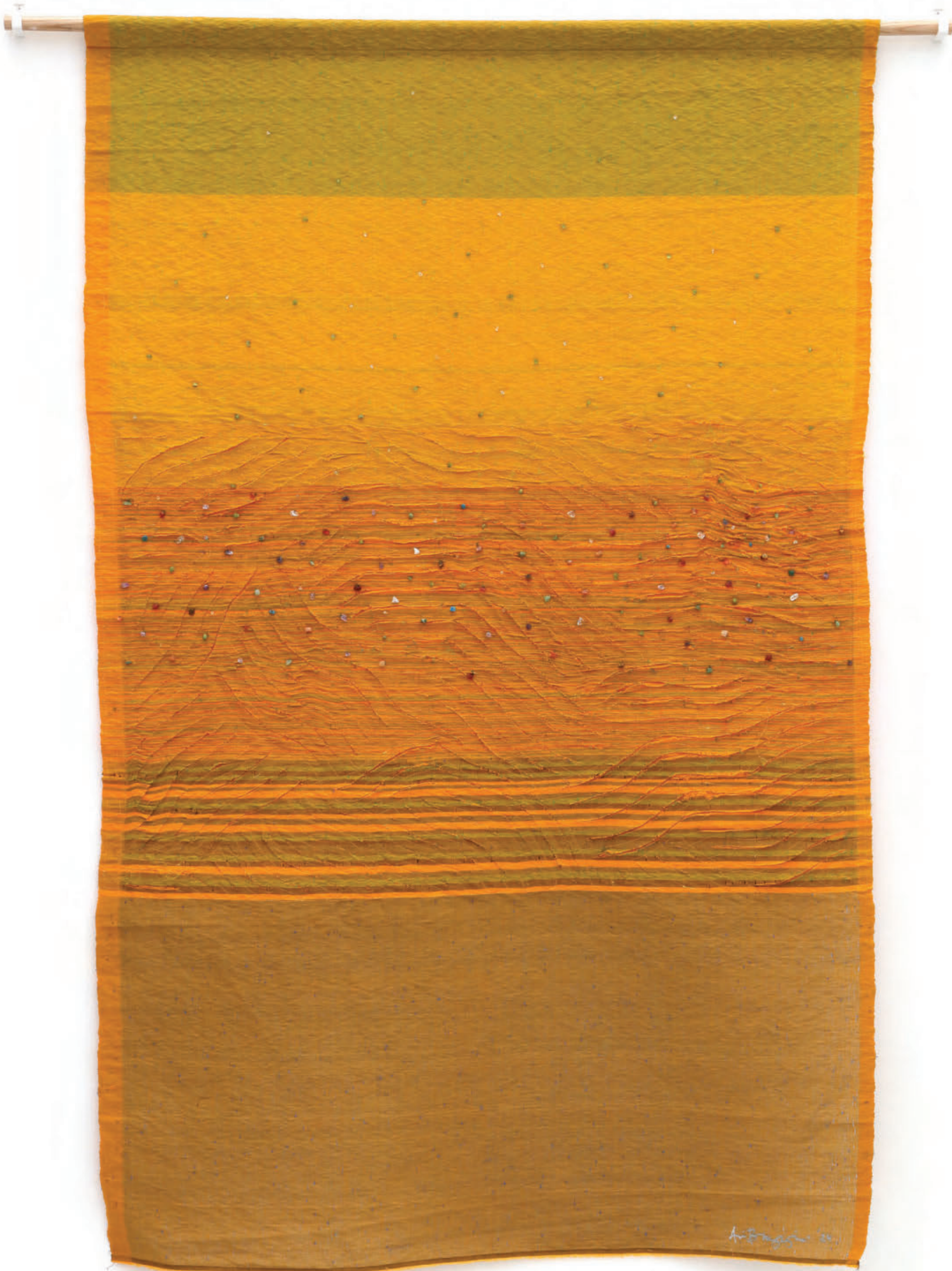
Sparkling Sea on the Horizon , 2024, Woven plastic and cotton threads, semi-precious stone beads, 169 x 105 cm