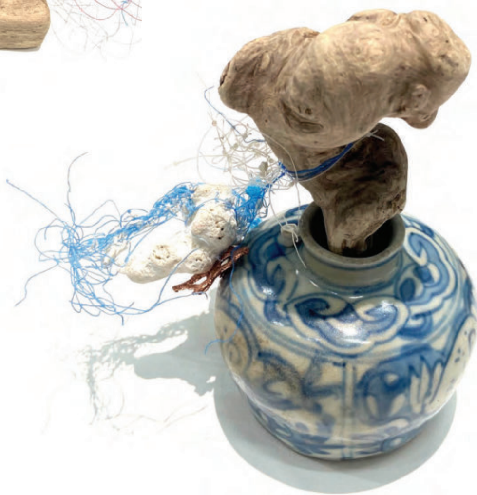
Holy Water #2, 2025