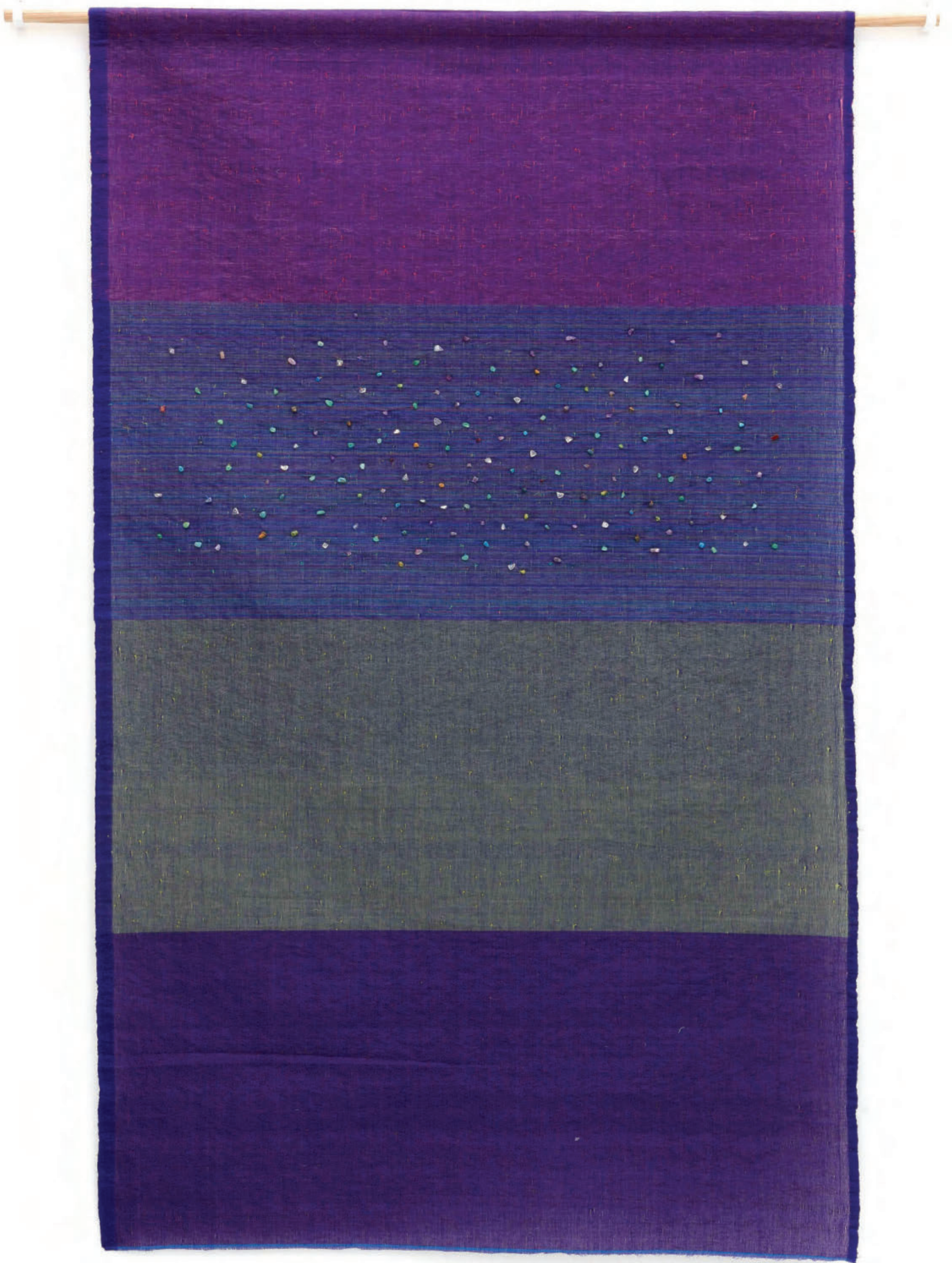
Night by the Beach , 2024, Woven plastic and cotton threads, semi-precious stone beads, 168 x 103 cm