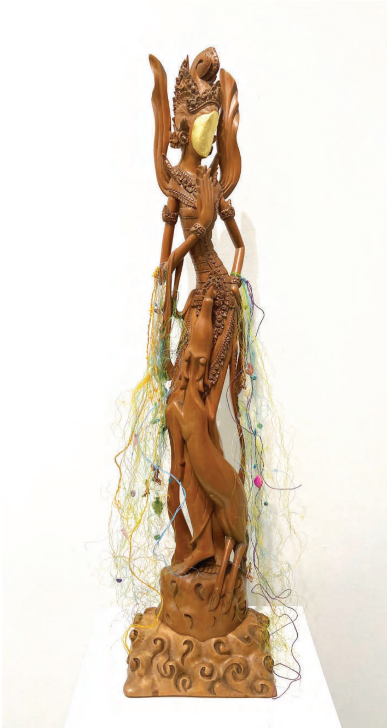
Nurture #2, 2025

Wood, plastic threads, glass, copper, semi-precious stones, 90 x 21 x 15 cm