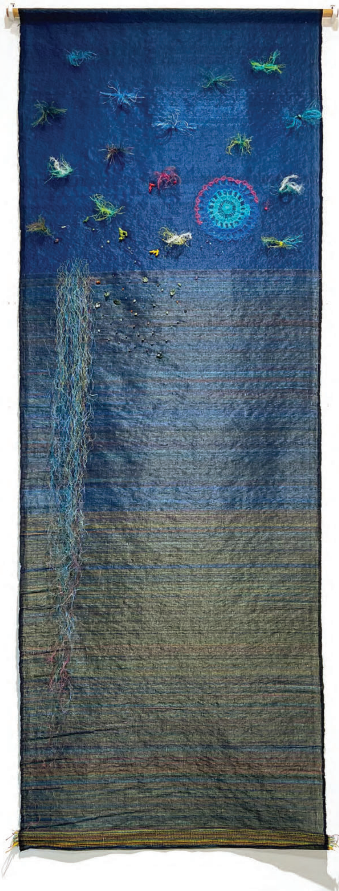
Estuary , 2024, Woven plastic and cotton threads, plastic threads, 284 x 110 cm