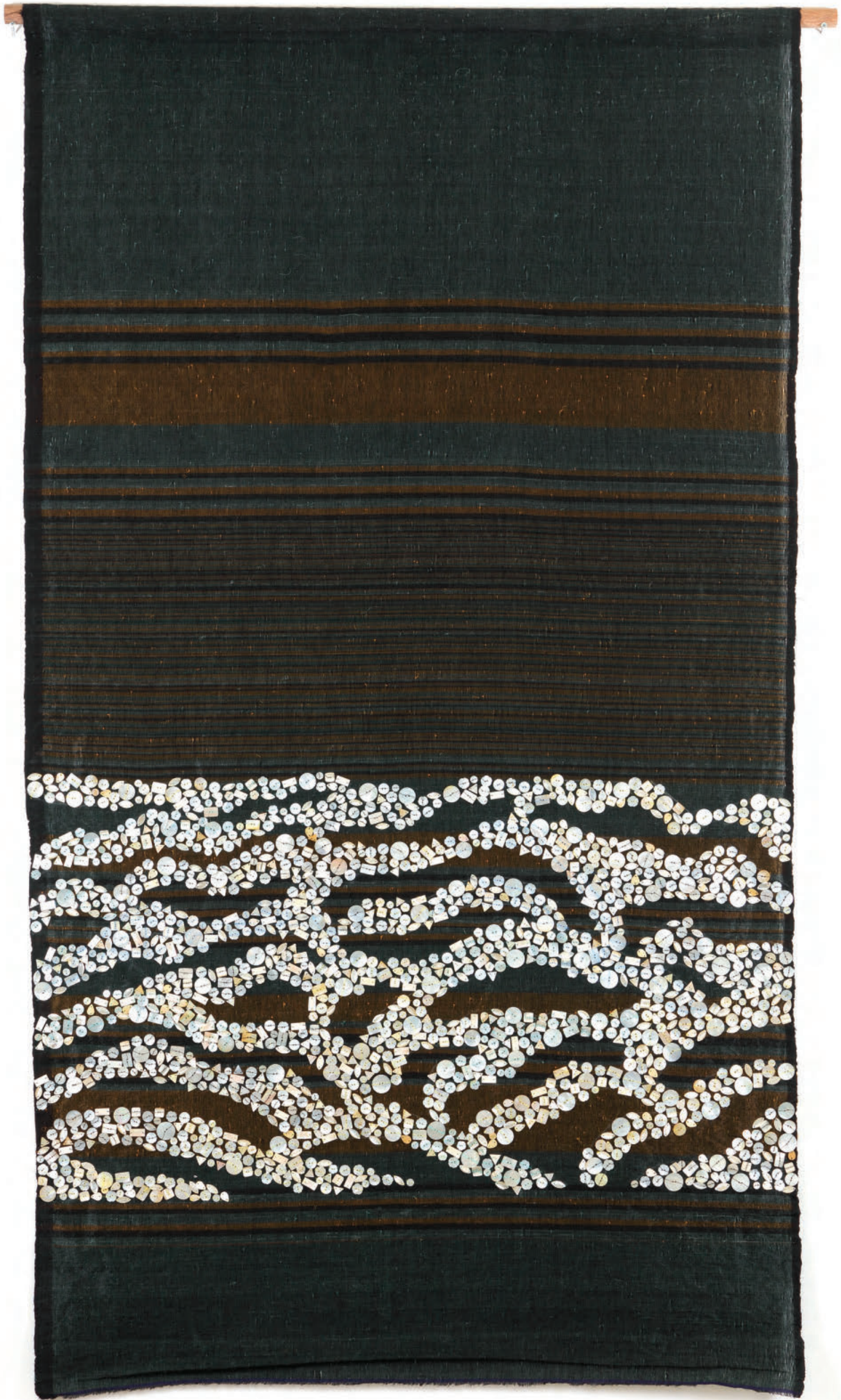
Calm Waves After the Storm , 2024, Woven plastic and cotton threads, mother of pearl, 185 x 103 cm