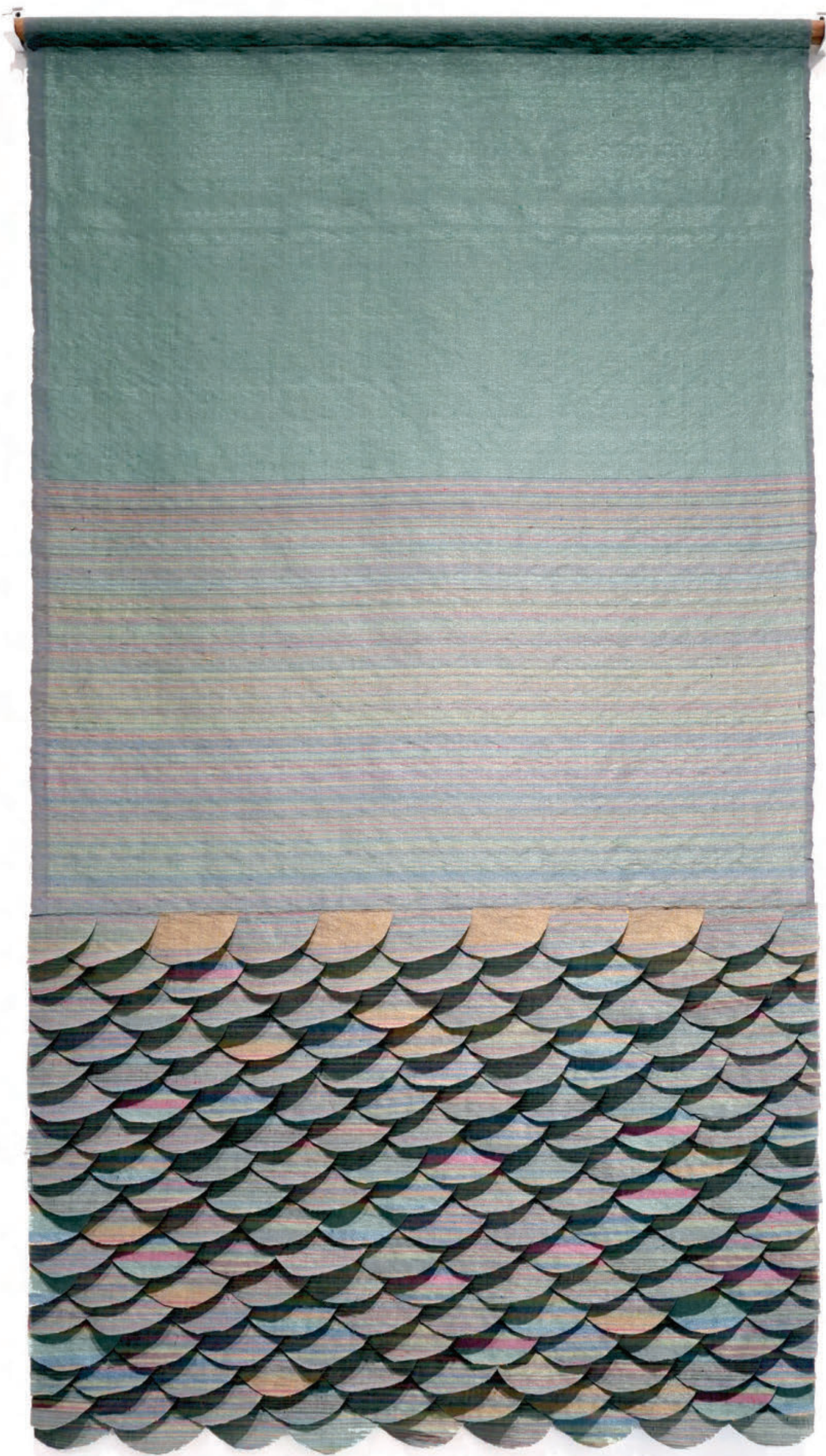
The Calm Wave of Sanur , 2022-2023, Woven plastic and cotton threads, plastic threads, 190 x 106 cm