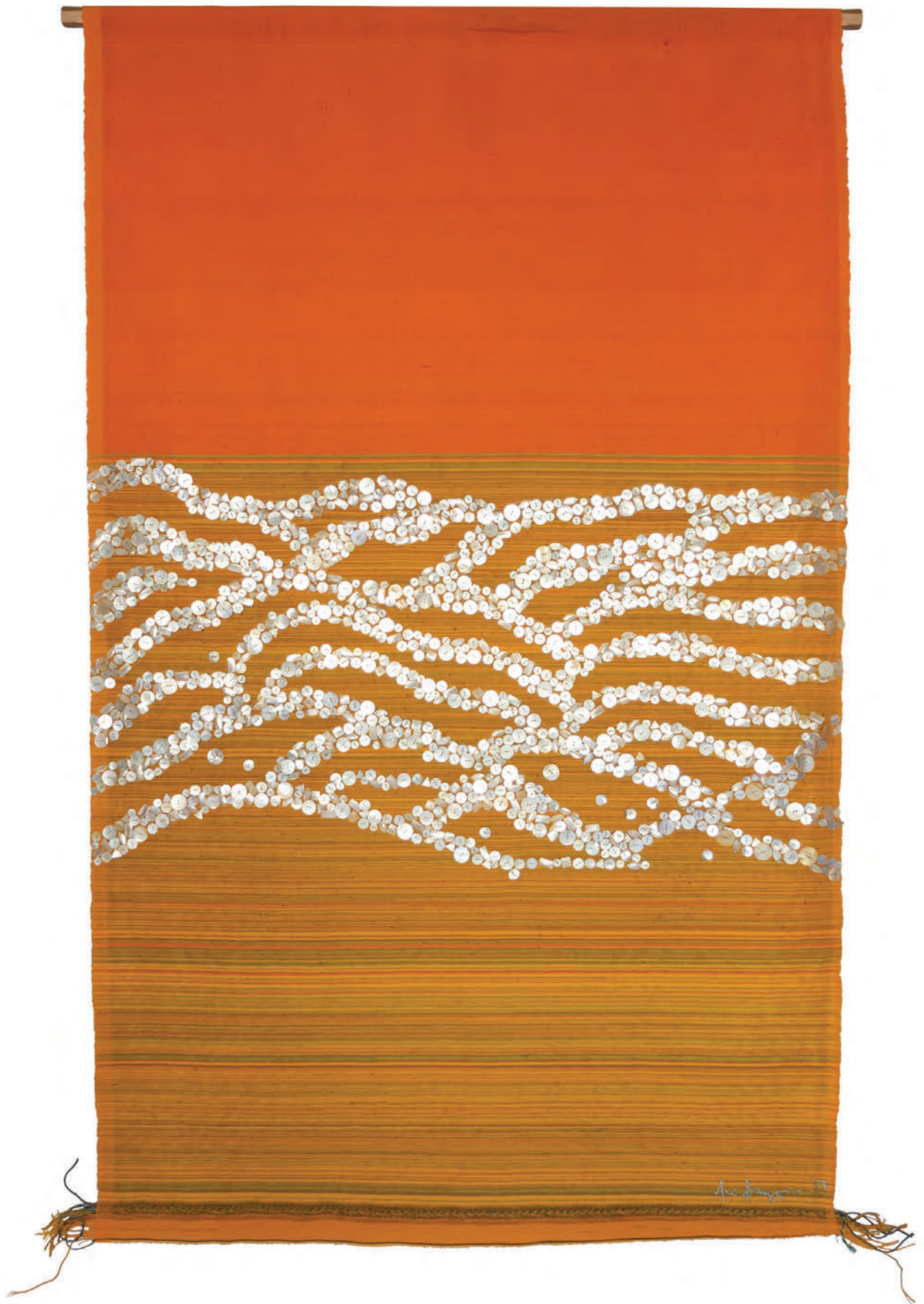
Sunrise at Dragon Bay, 2024, Woven plastic and cotton threads, mother of pearl, 169 x 139 cm