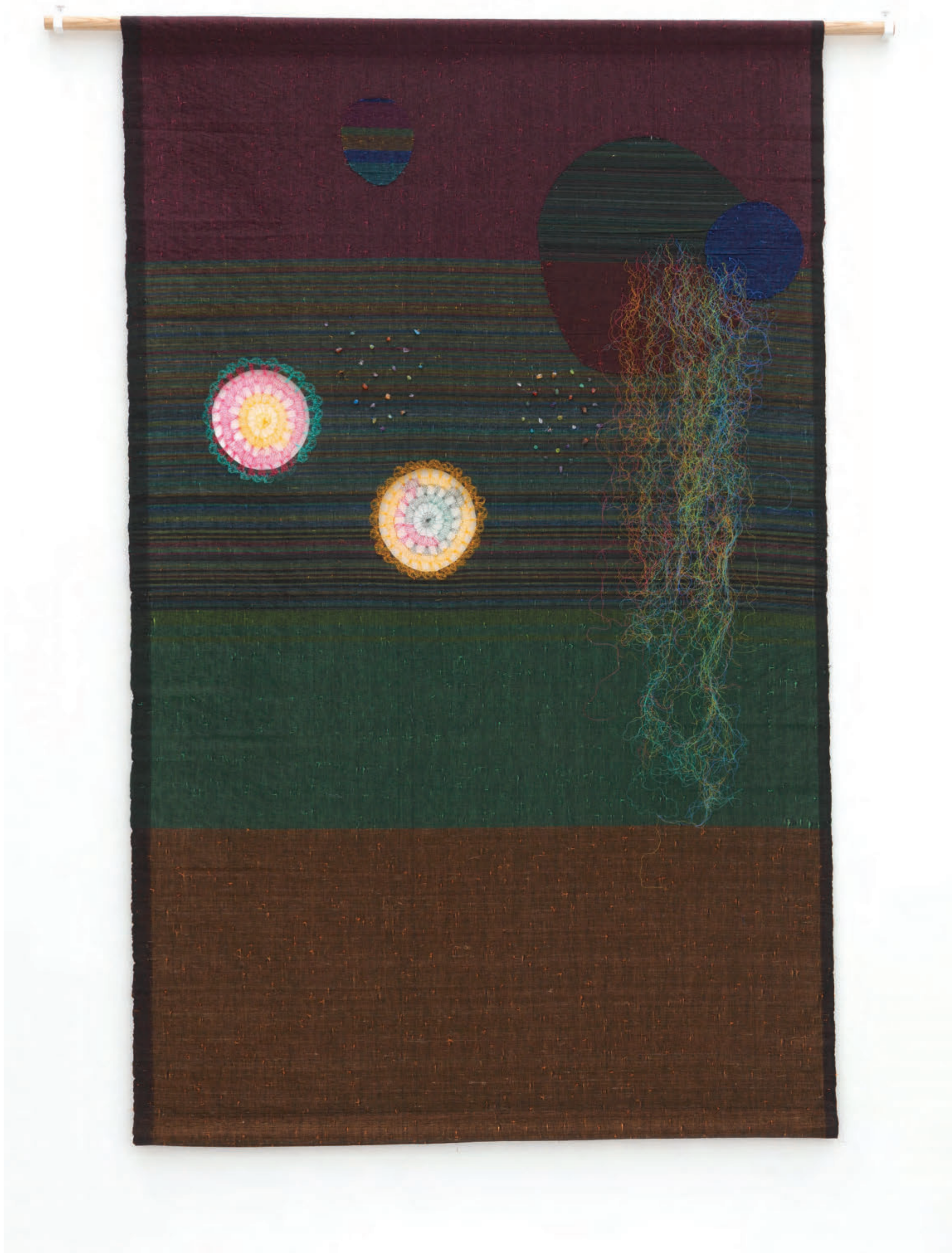
The Sun Rays Under the Water , 2023, Woven plastic and cotton threads, plastic threads, semi-precious stone beads, 169 x 104 cm