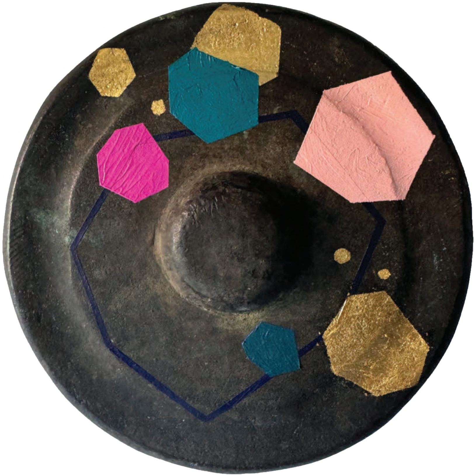
Triangulum Galaxy , 2017-2023

Bronze, gold leaf, acrylic paint, Ø 18 x 4 cm